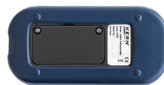
Vista posteriore, coperchio del vano batterie avvitato